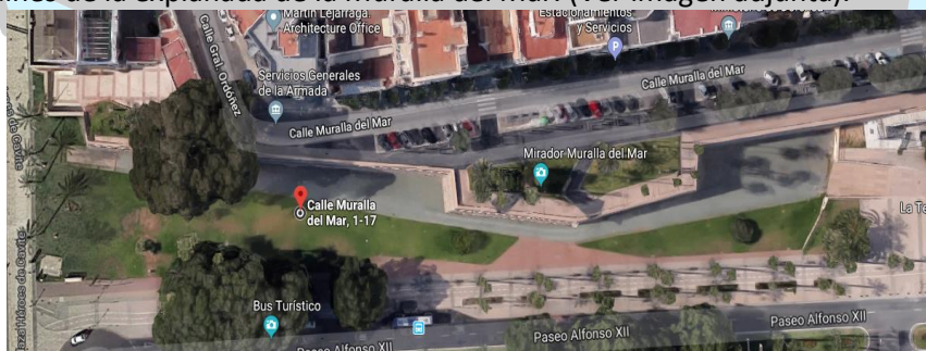
Lugar de realización de los juegos de presentación el sábado.

Por la mañana del sábado tendremos el montaje hasta las 11, luego cogeremos un autobús para ir al centro de Cartagena, donde haríamos la inauguración, que tendrá lugar en las escaleras del palacio consistorial. Después de la inauguración empezaremos con las actividades. Juegos de presentación todos juntos en los jardines de la explanada de la Muralla del Mar. (Ver imagen adjunta).